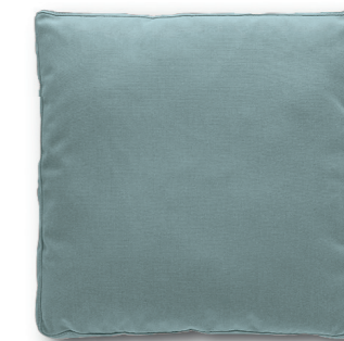
Art. 50 — 40 x 40 Art. 51 — 50 x 50