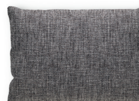
Art. 53 — 50 x 35

rettangolare — rectangular rectangulaire — rechteckige