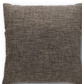
Art. 50 — 40 x 40 Art. 51 — 50 x 50