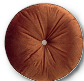
Art. 43 — ø50