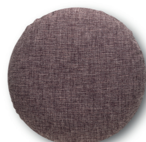
Art. 43 — ø50