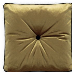
Art. 50 — 40 x 40 Art. 51 — 50 x 50