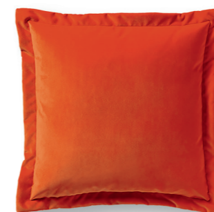
Art. 51 — 58 x 58