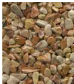
Breccia Pernice B