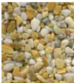
Giallo Siena B