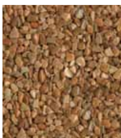
Rosso Verona A