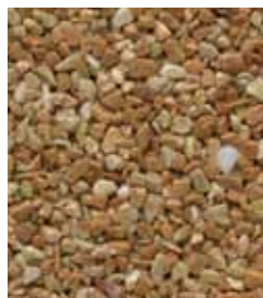
Breccia Pernice A