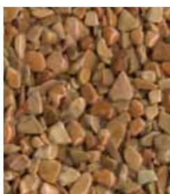
Rosso Verona B