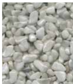
Bianco Carrara B

A seconda dell'architettura e dell'atmosfera è possibile scegliere da un'ampia gamma di colori e di ciottoli di varie dimensioni. Le superfici possono anche essere suddivise e decorate con tonalità diverse. Troverete ulteriori suggerimenti ed esempi sul sito www.triflex.com (Triflex Studio per balconi e terrazze).