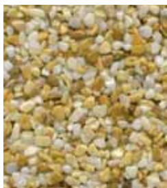
Giallo Siena A

... Ampia scelta di colori e granulometrie di graniglie