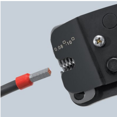
Crimpaggio a sezione quadra