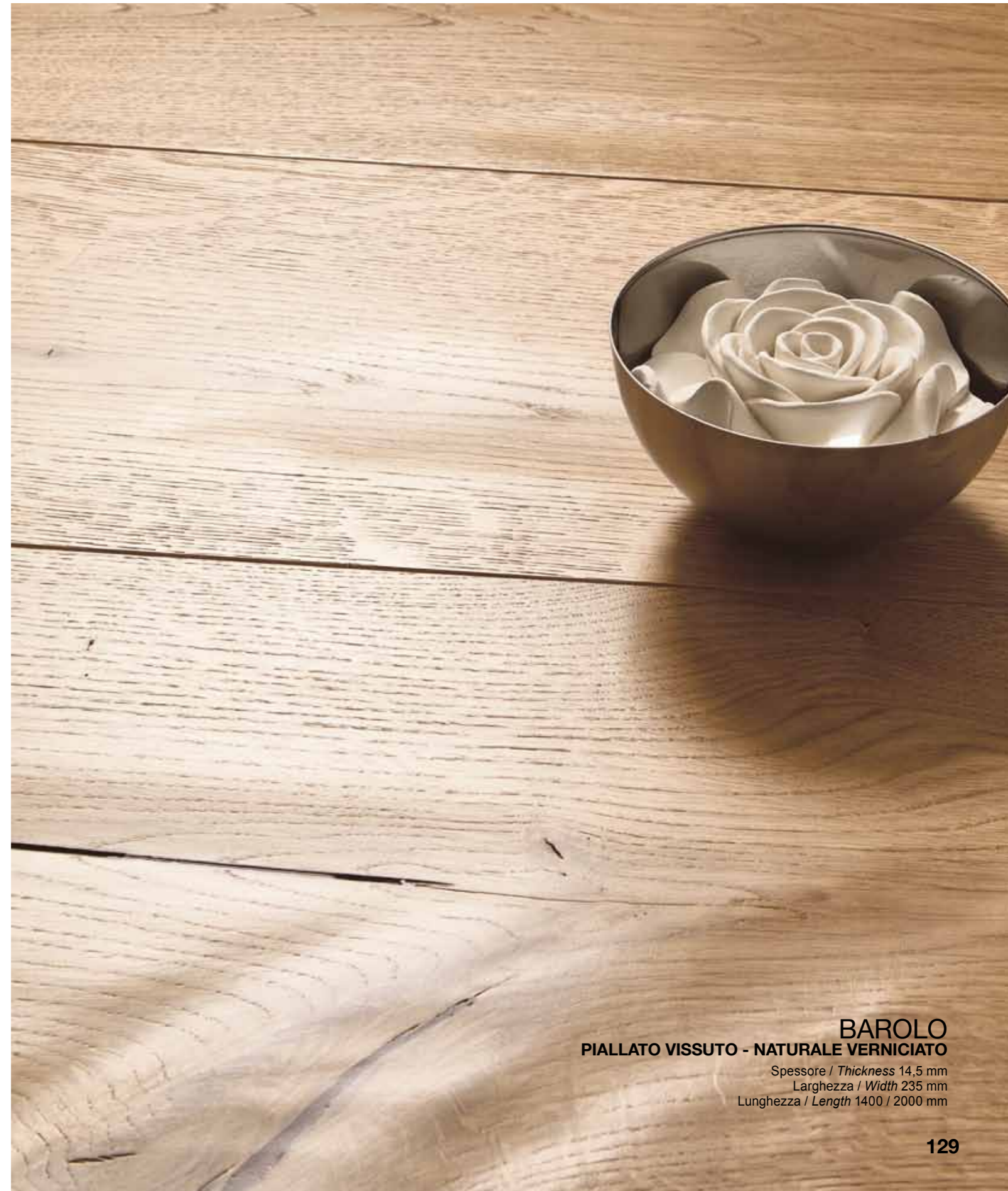
BAROLO PIALLATO VISSUTO - NATURALE VERNICIATO

Spessore / Thickness 14,5 mm Larghezza / Width 195 mm Lunghezza / Length 1400 / 2000 mm