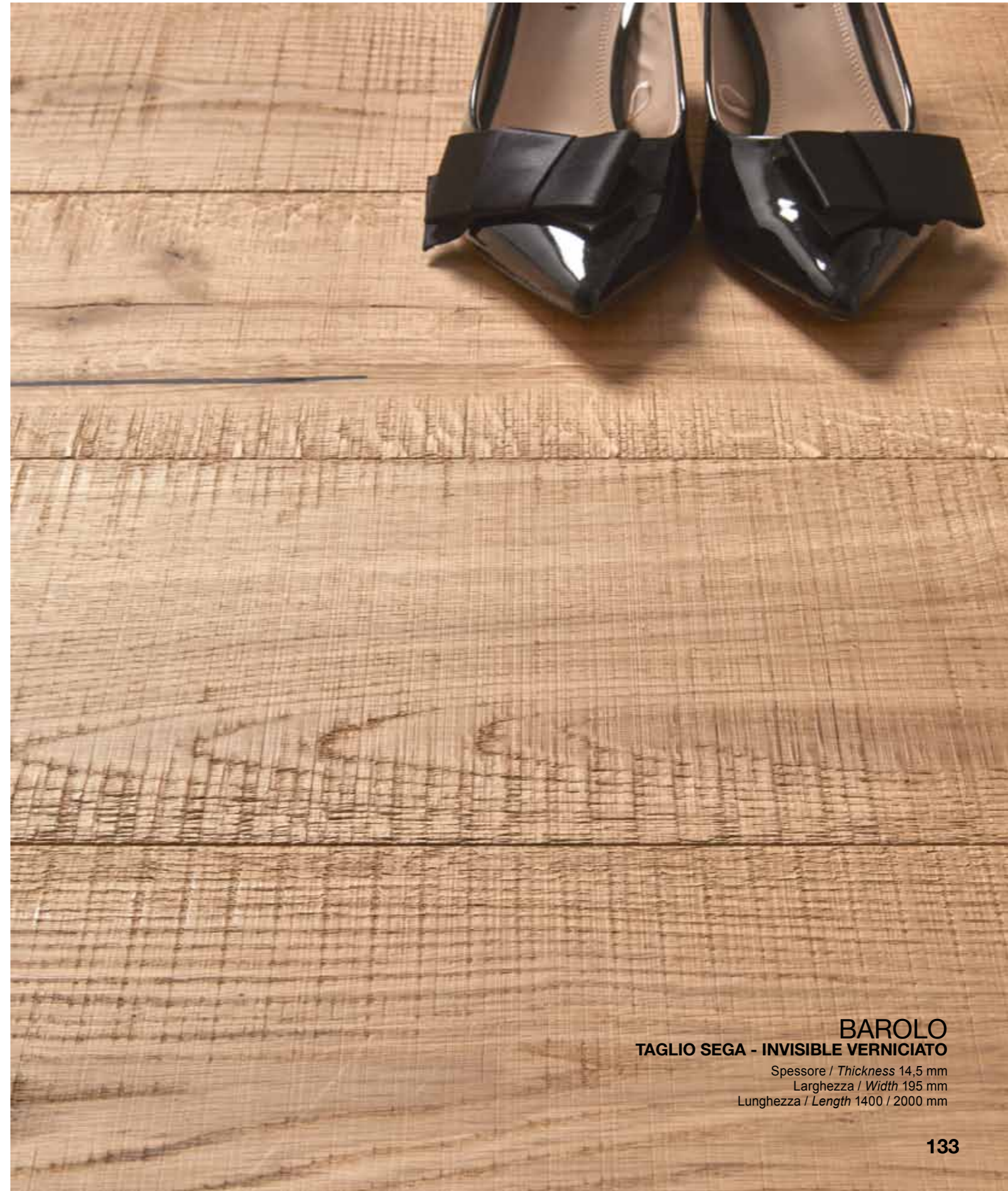
BAROLO TAGLIO SEGA - INVISIBLE VERNICIATO

Spessore / Thickness 14,5 mm Larghezza / Width 195 mm Lunghezza / Length 1400 / 2000 mm