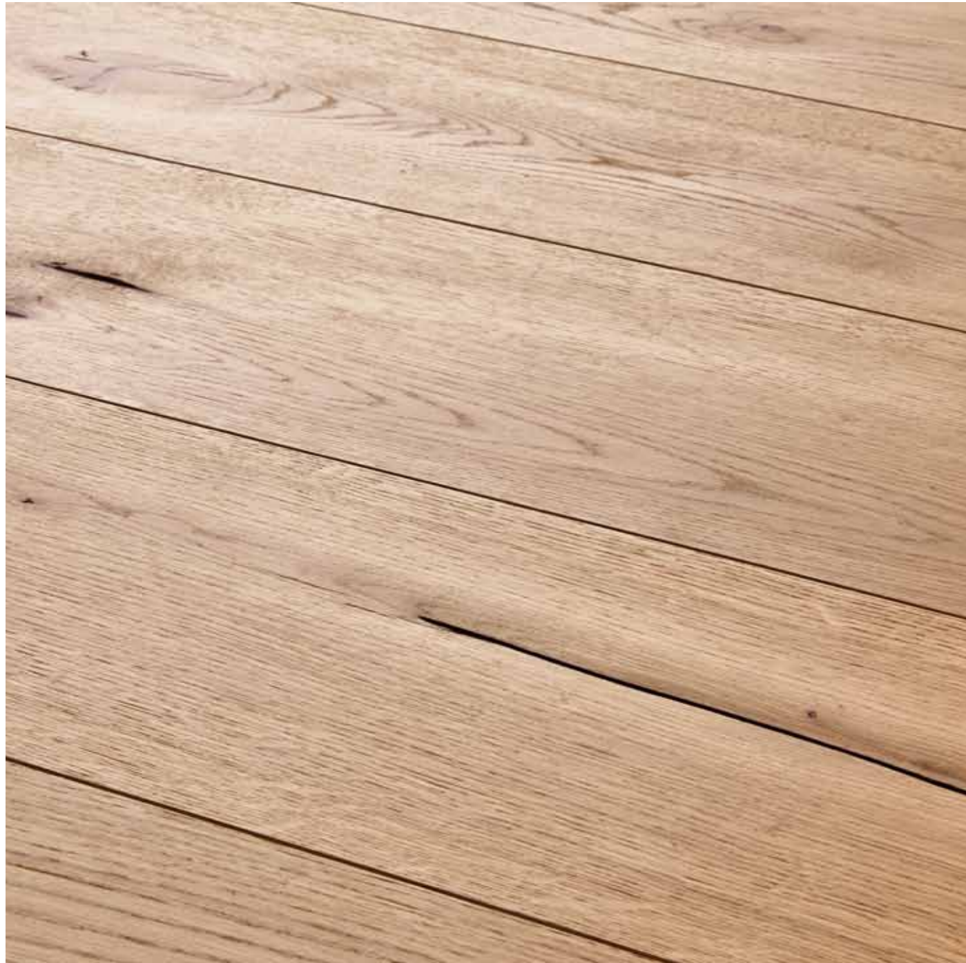
BAROLO PIALLATO VISSUTO - INVISIBLE VERNICIATO

Spessore / Thickness 14,5 mm Larghezza / Width 195 mm Lunghezza / Length 1400 / 2000 mm