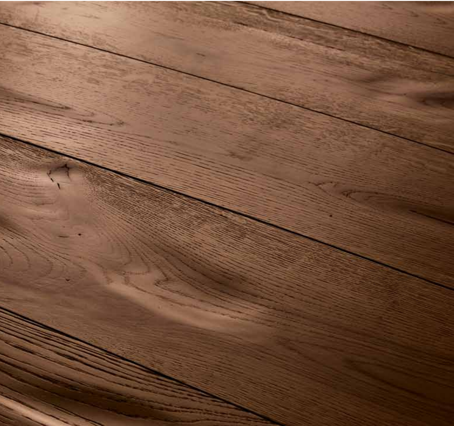
BAROLO PIALLATO VISSUTO - NOCE SCURO OLIATO

Spessore / Thickness 14,5 mm Larghezza / Width 195 mm Lunghezza / Length 1400 / 2000 mm