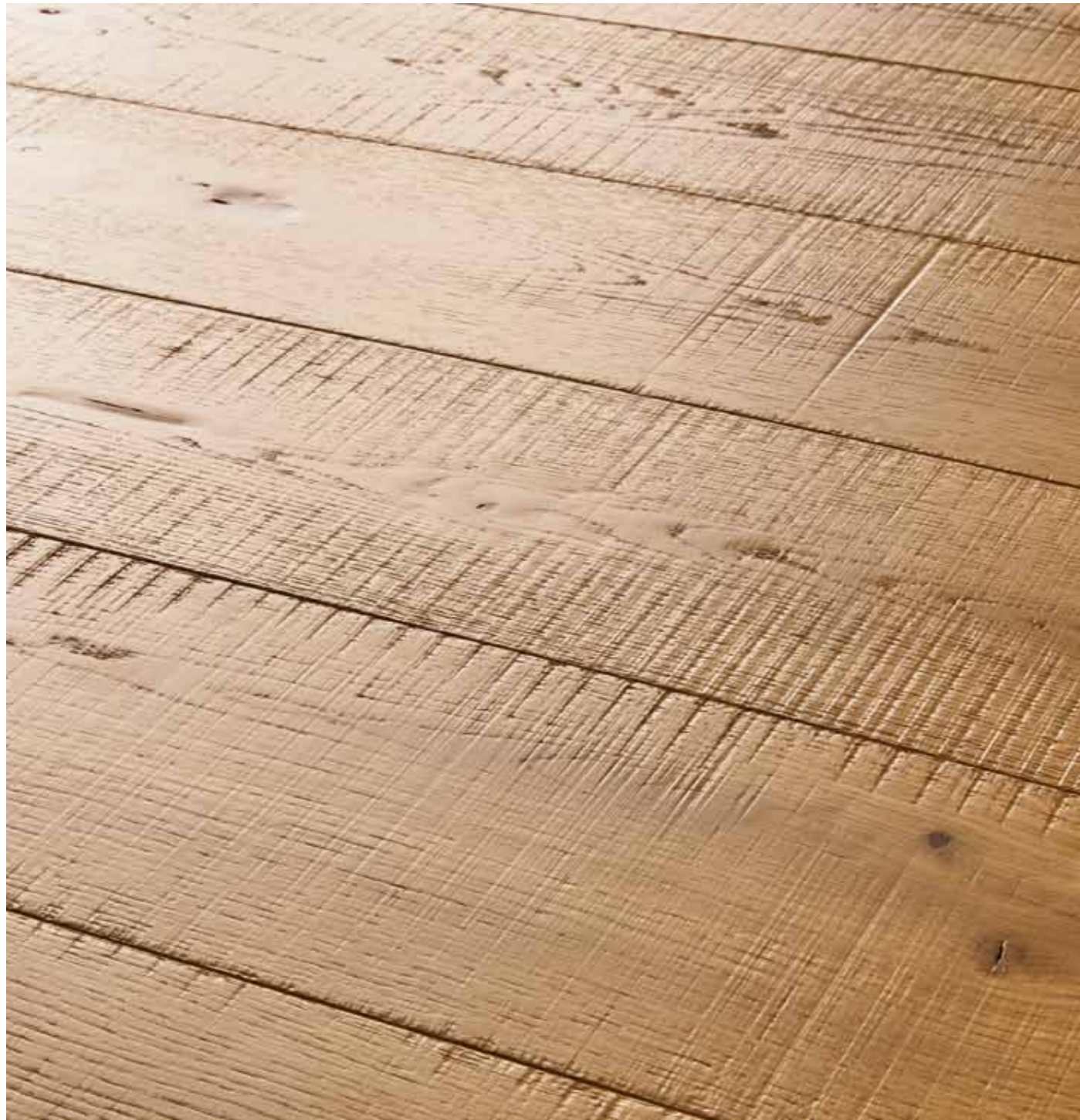
BAROLO TAGLIO SEGA - NATURALE VERNICIATO

Spessore / Thickness 14,5 mm Larghezza / Width 195 mm Lunghezza / Length 1400 / 2000 mm