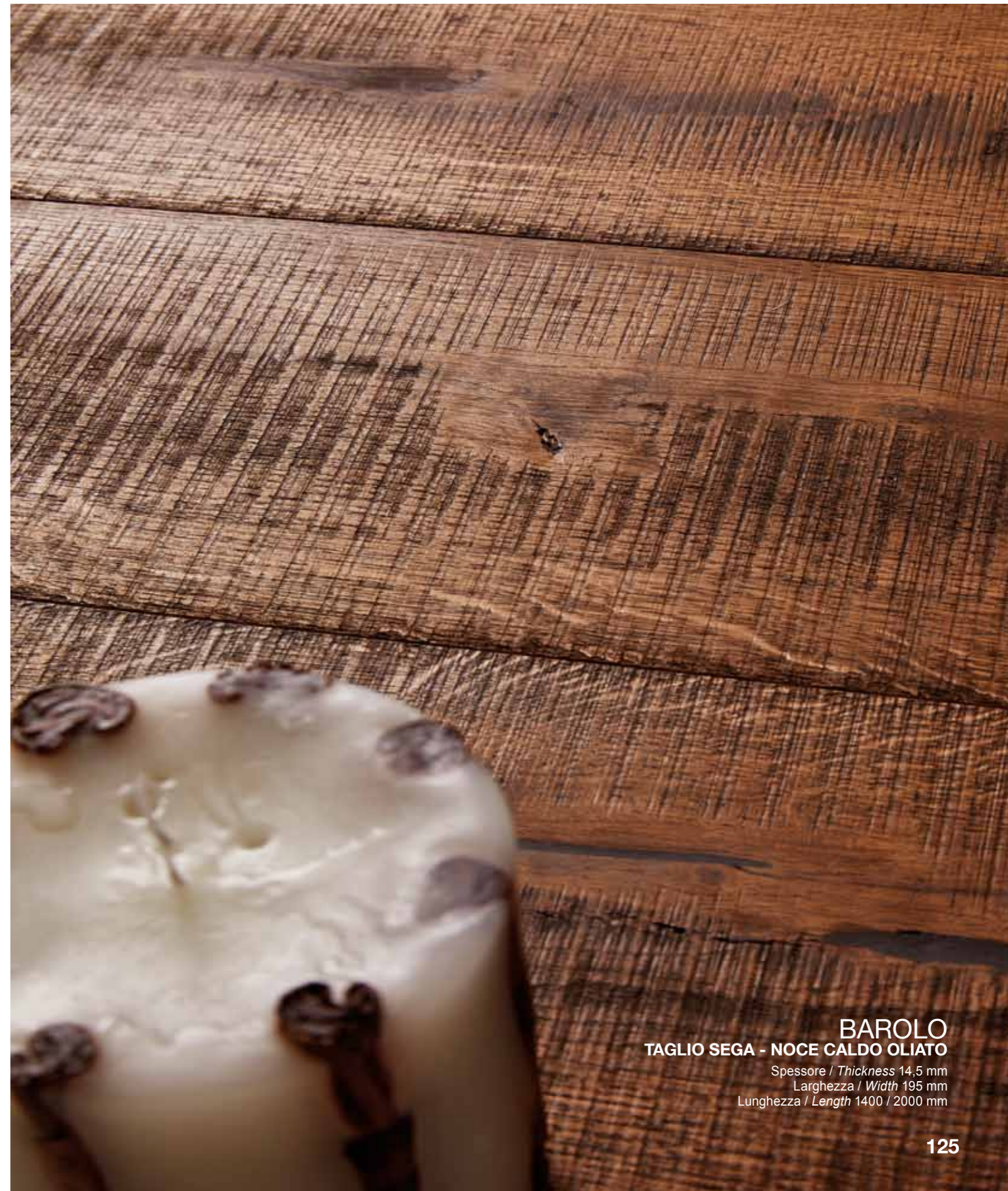
BAROLO TAGLIO SEGA - NOCE CALDO OLIATO

Spessore / Thickness 14,5 mm Larghezza / Width 195 mm Lunghezza / Length 1400 / 2000 mm