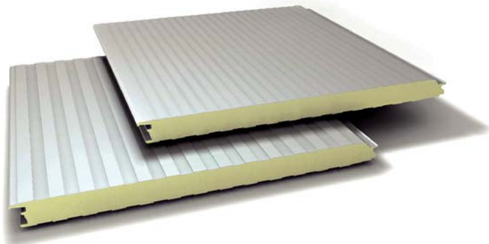
PARTICOLARE DEL GIUNTO

Panneaux de bardage avec isolation en mousse polyuréthane avec fixation invisible